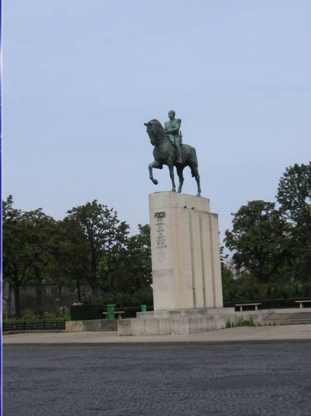
Памятник маршалу Фошу