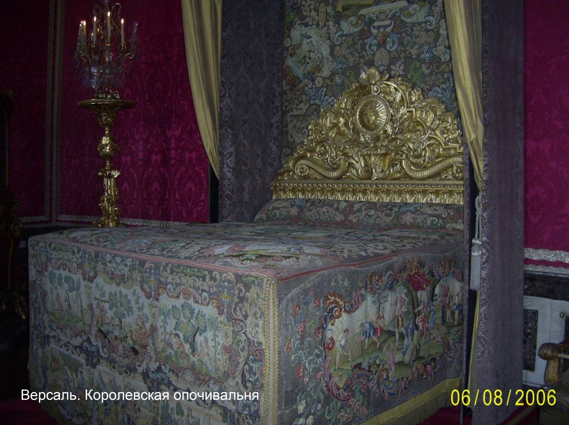
Версаль. Королевская опочивальня