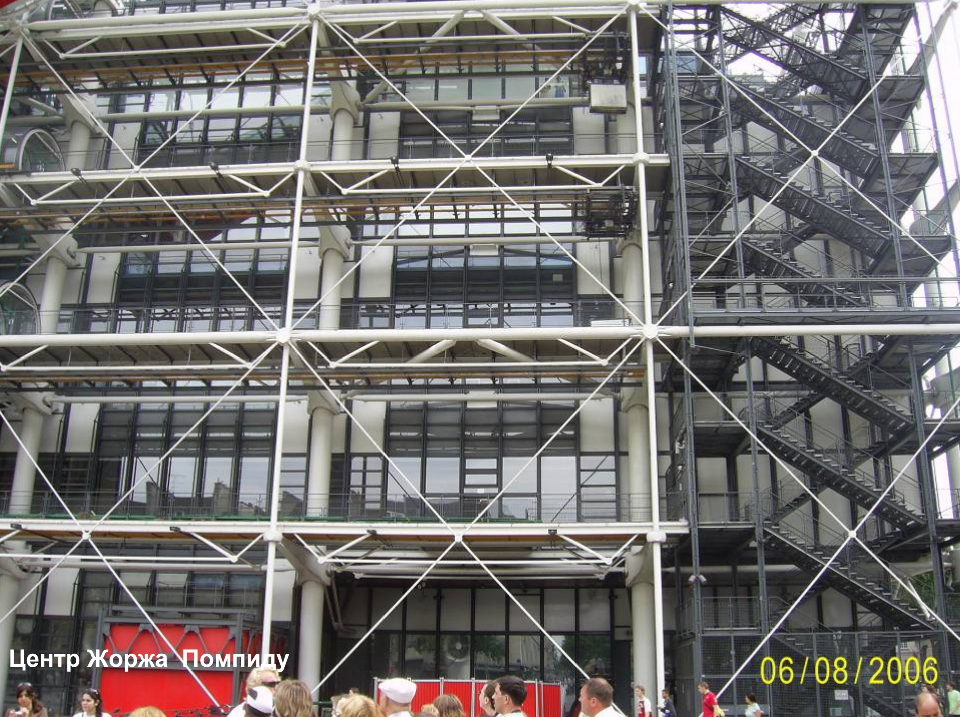
Центр Жоржа Помпиду