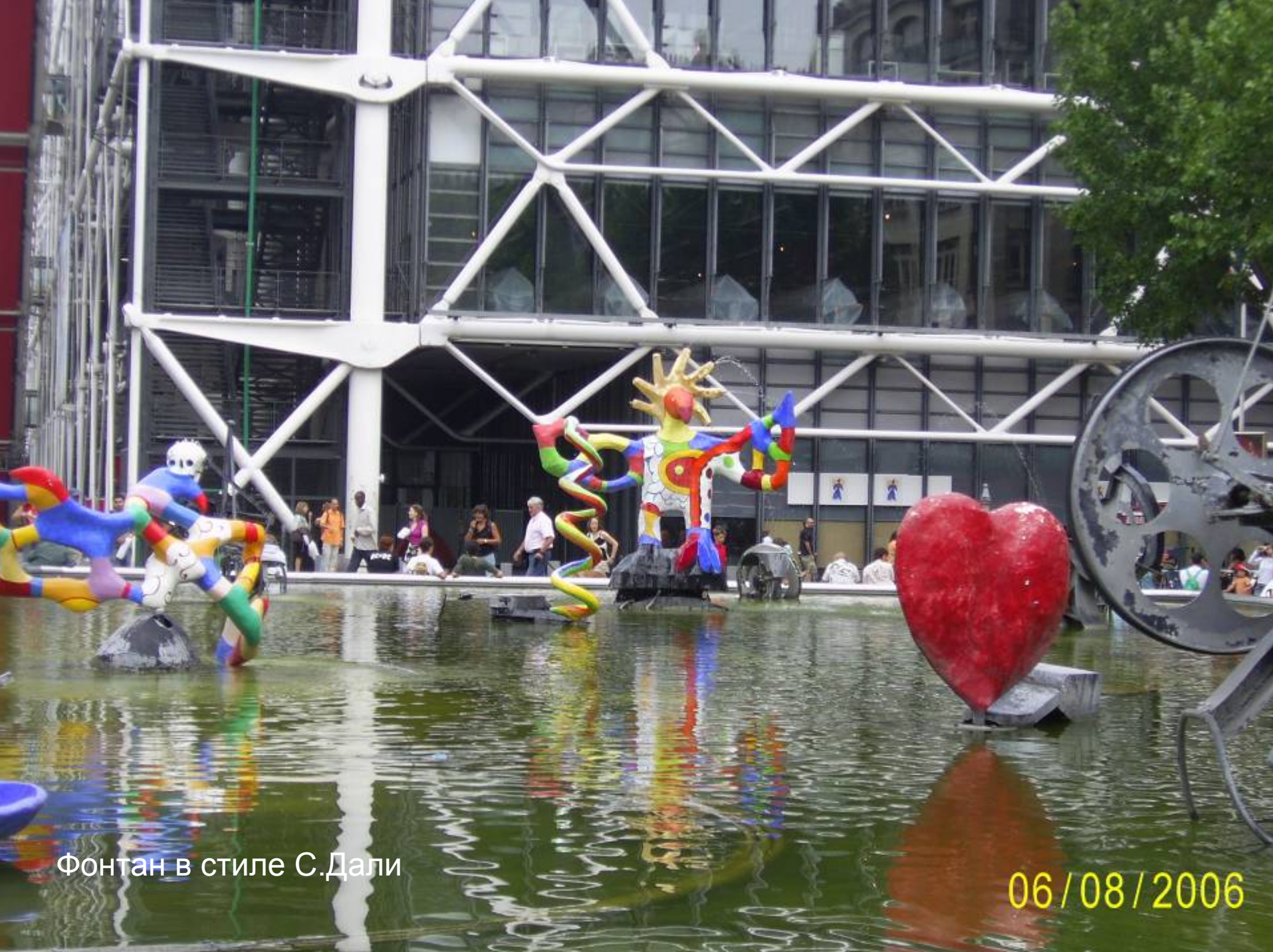
Фонтан в стиле С.Дали