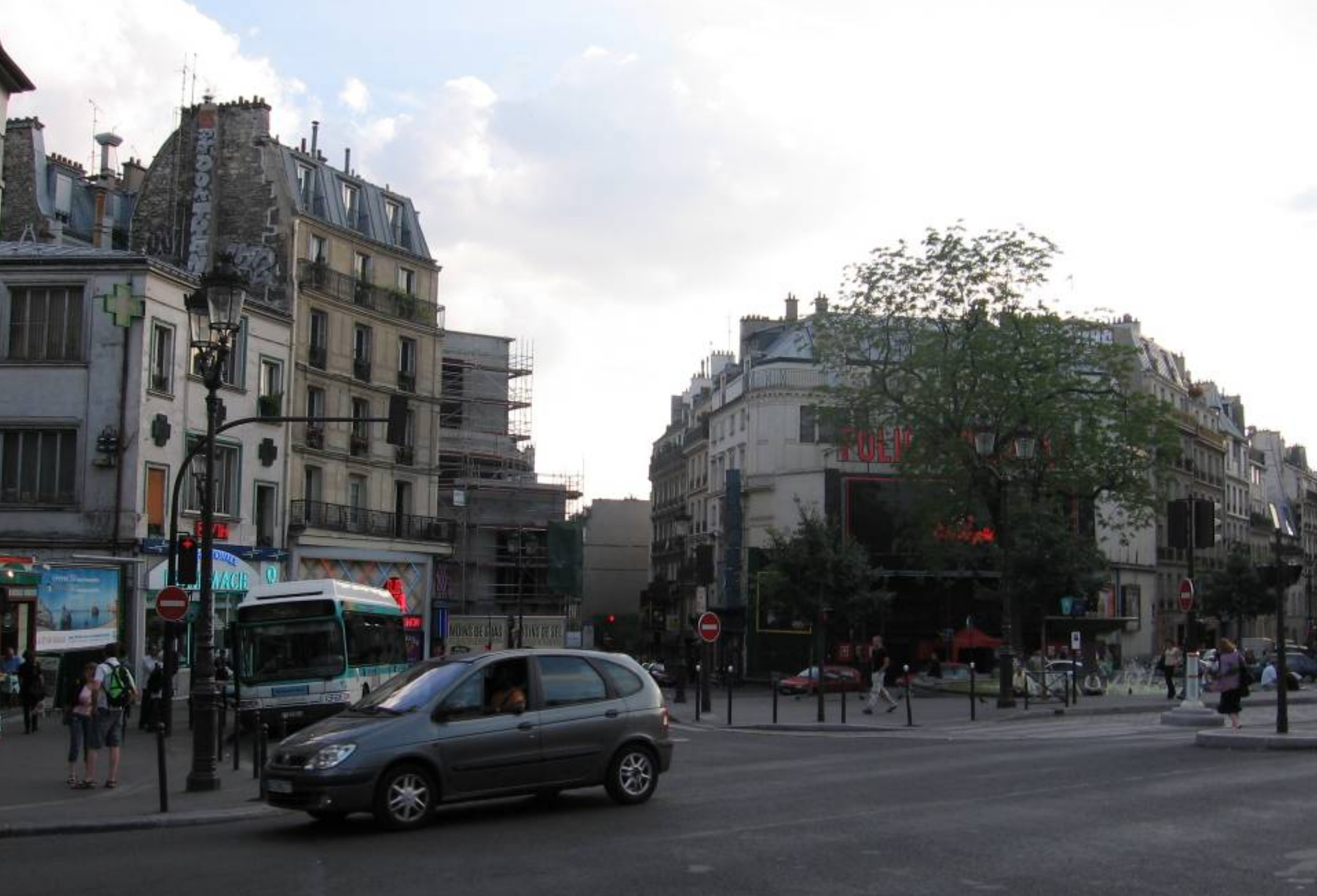
Пласе Ригале – квартал красных фонарей