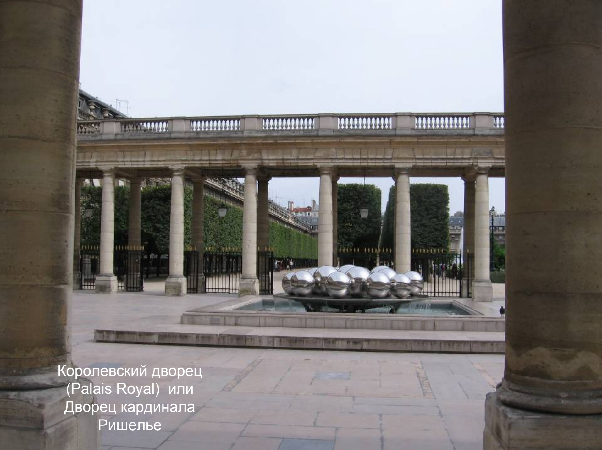
Королевский дворец (Palais Royal) или Дворец кардинала Ришелье