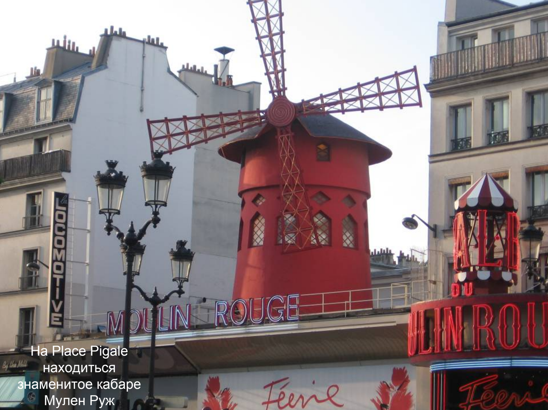
На Place Pigale находится знаменитое кабаре Мулен Руж