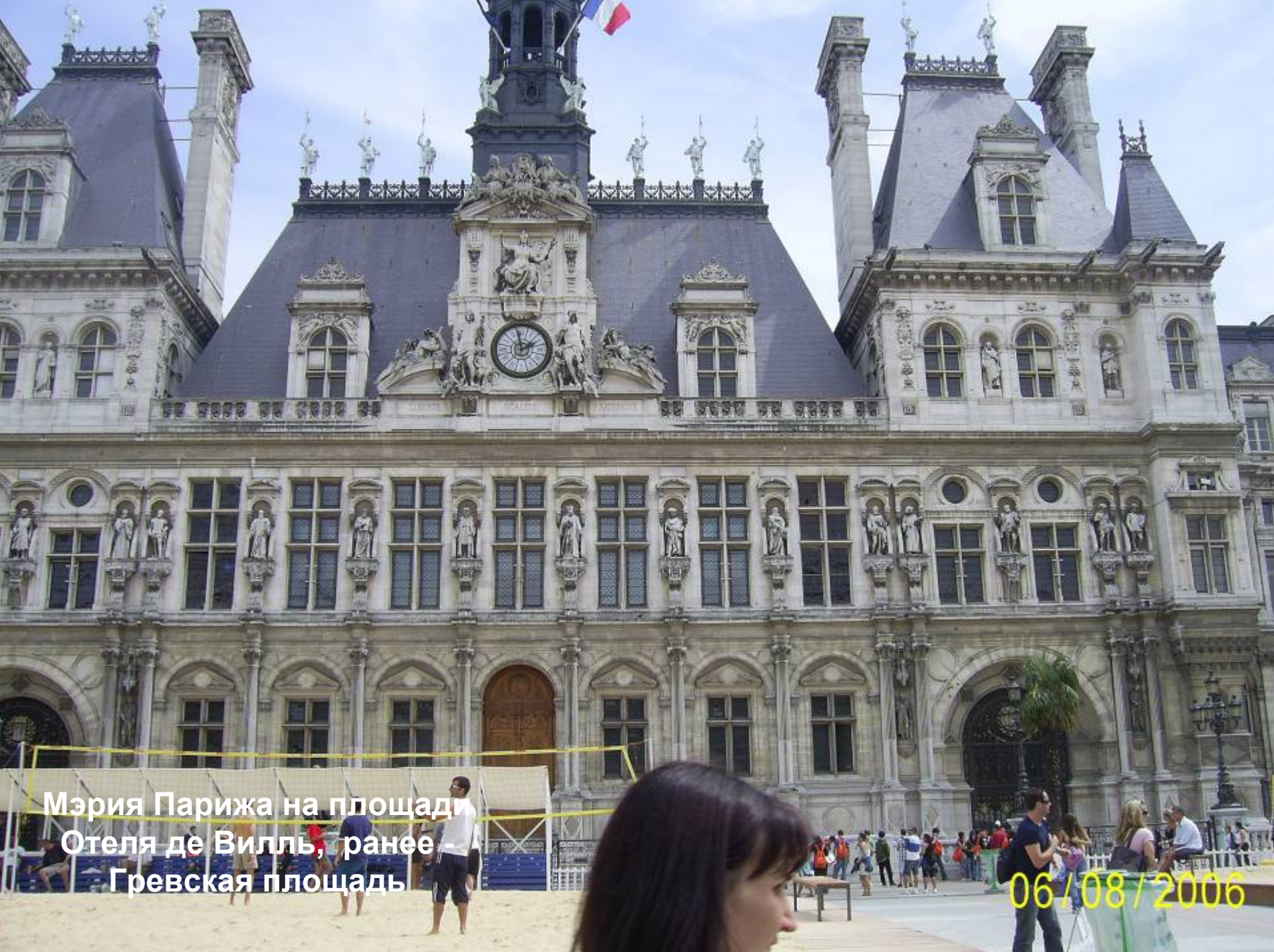
Мэрия Парижа на площади Отеля де Виль, ранее Гревская площадь