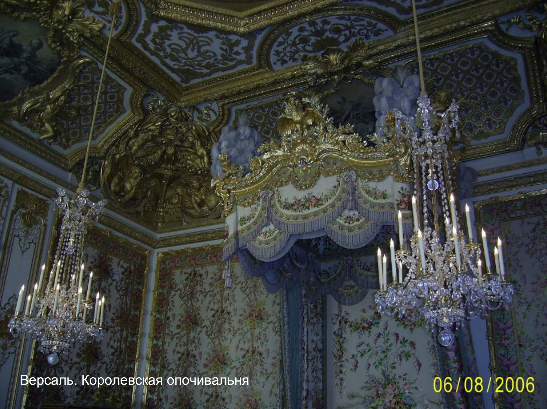
Версаль. Королевская опочивальня