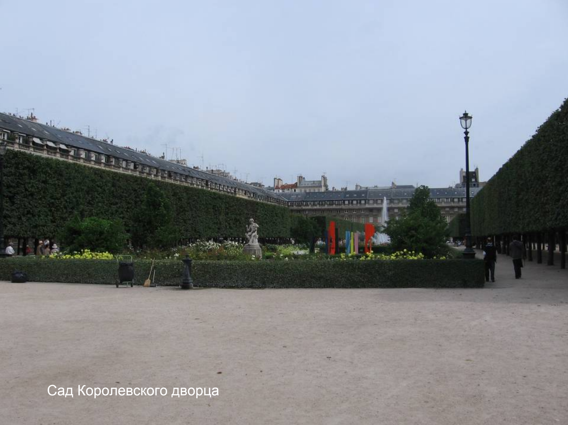
Сад Королевского дворца