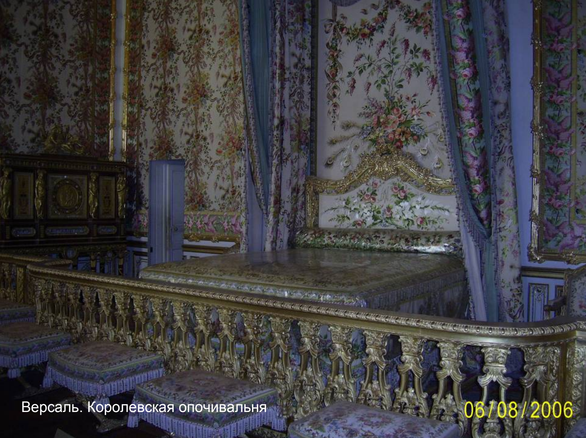
Версаль. Королевская опочивальня