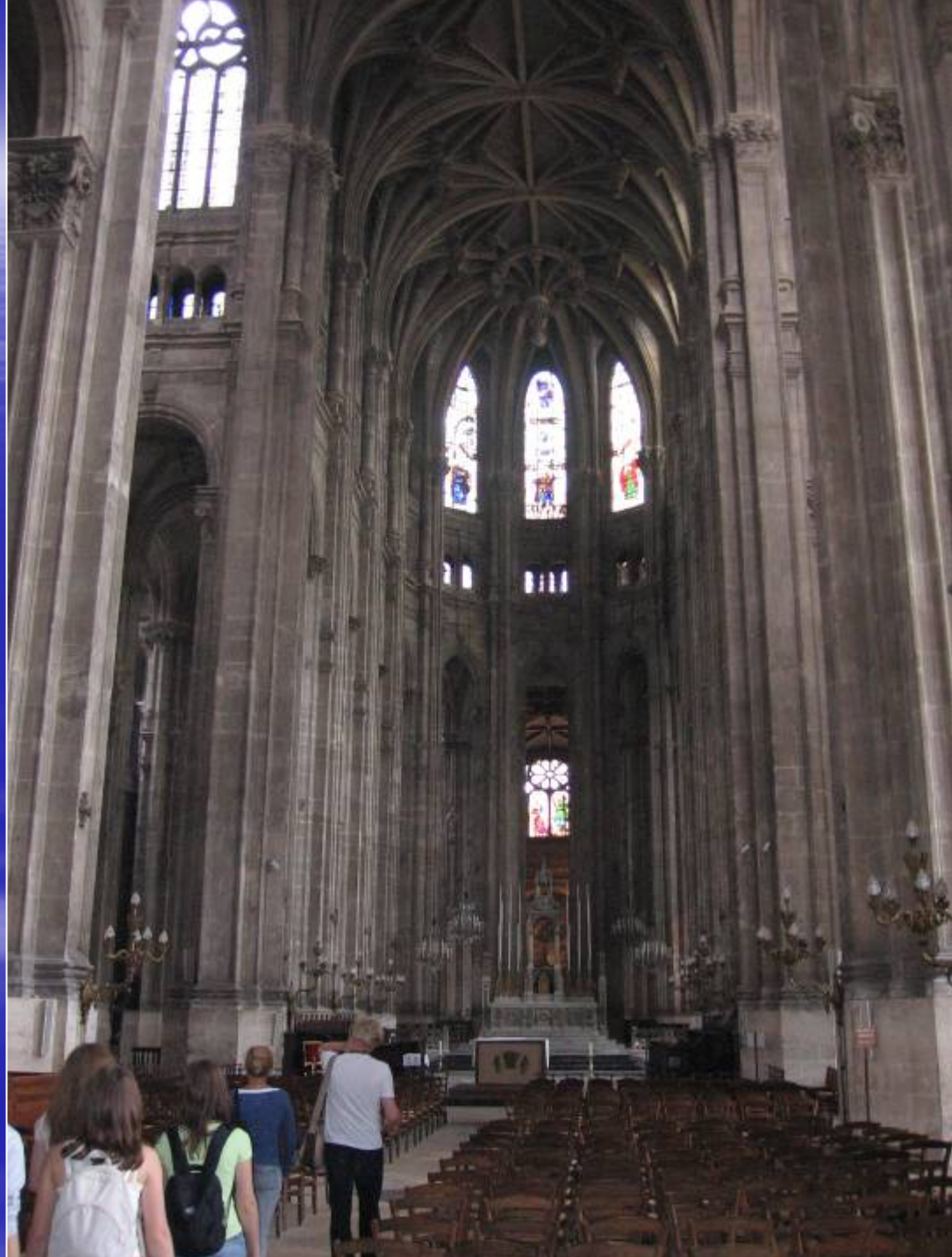
Церковь св. Евстафия