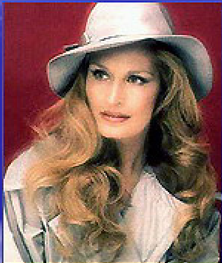
Французская певица Далида