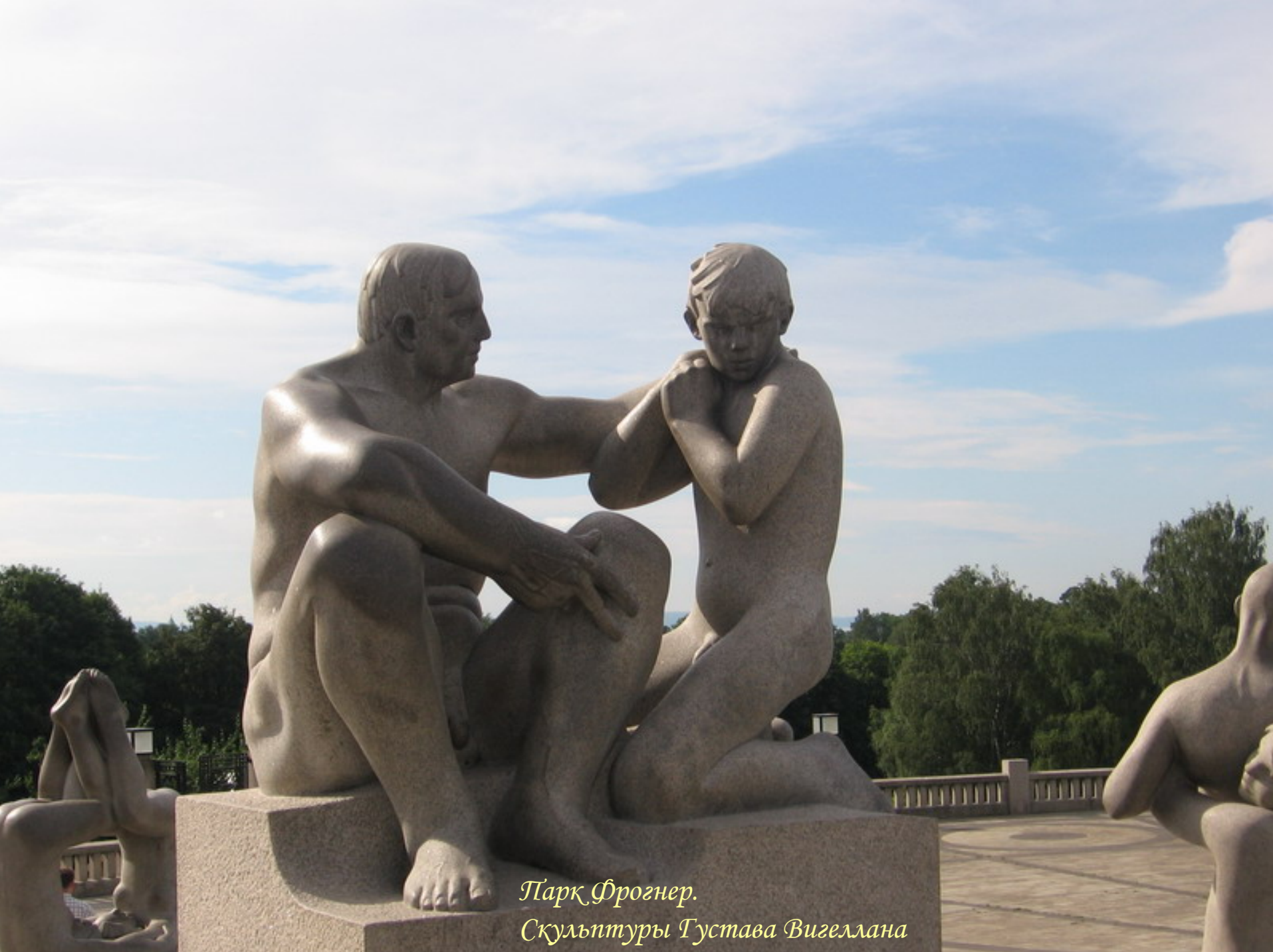
Парк Фрогнер. Скульптуры Густава Вигеллана