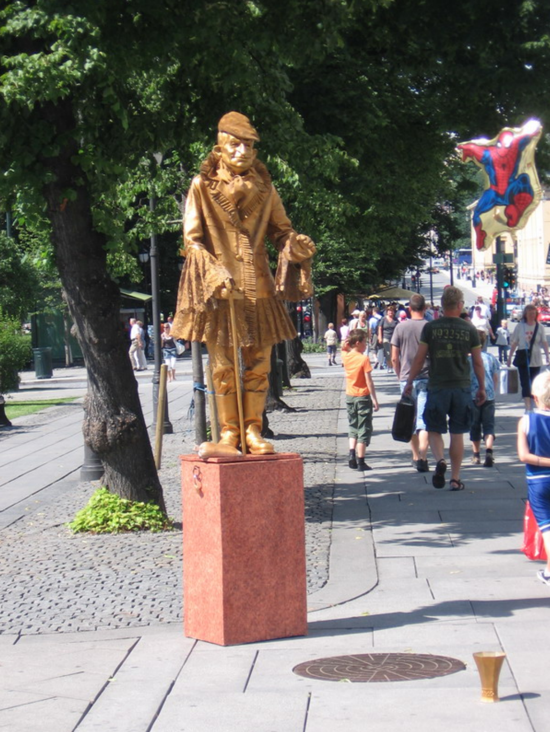
Осло. Живая скульптура