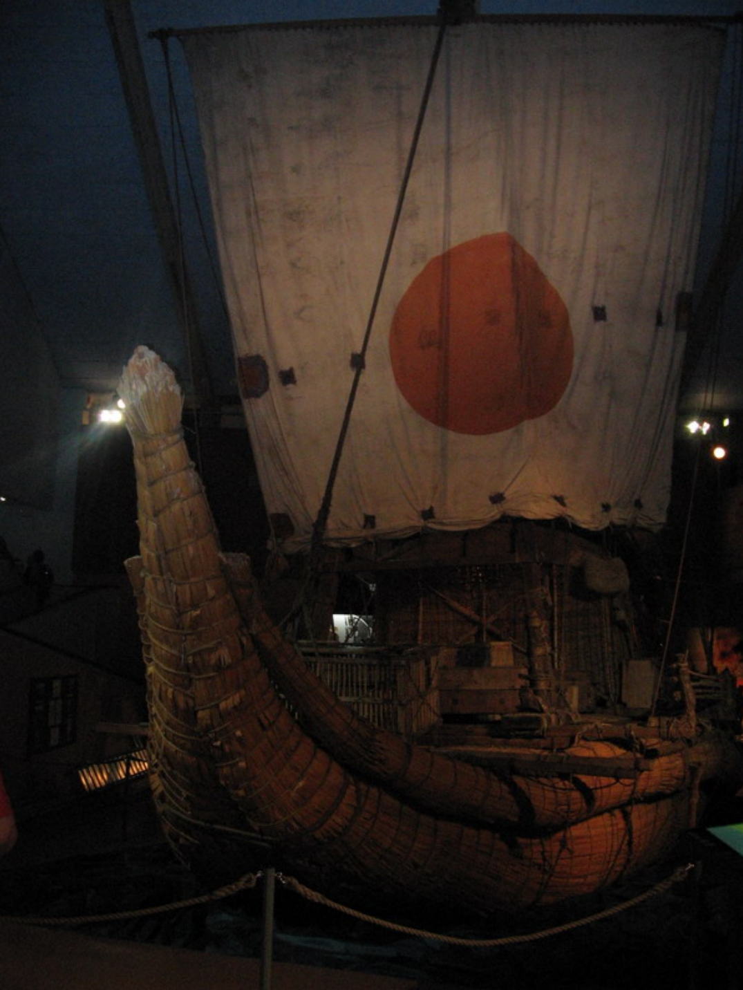
«Кон-Тики» Т. Хейердала